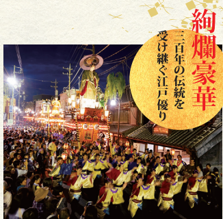
絢爛豪華 三百年の伝統を 受け継ぐ江戸優り

佐原の山車行事は、それぞれの鎮守祭礼の「つけ祭り」として行われてきた行事です。各町内が大人形などで飾りつけた豪華な山車を佐原囃子の調べにのせて勇壮に、時には激かに曳き廻します。