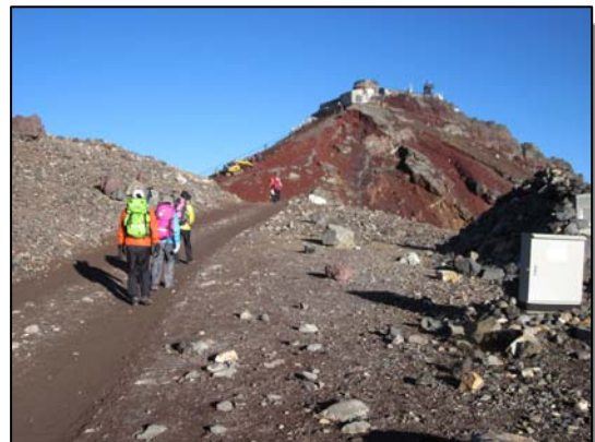
富士山 剣ヶ峰 2013.08