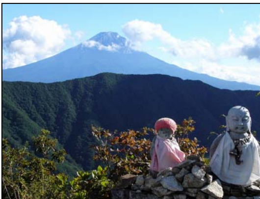
黒岳・釈迦ヶ岳から 2010.09