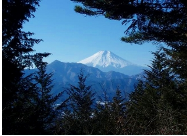
九鬼山からの富士山 2009.01