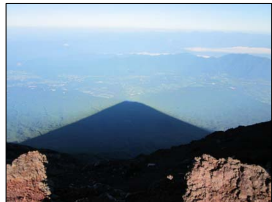
富士山頂からの富士山の影 2013.08