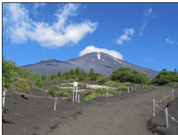
御殿場新五合目登山口から 2013.07