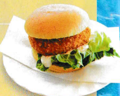
▲メカジキメンチカツバーガー